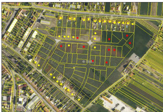
Stav využití stavebních parcel a zastavěnost v lokalitě (září 2017)