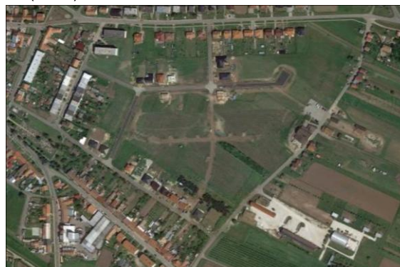
Nejaktuálnější letecký snímek (www.maps.google.com)

Na základě provedeného vyhodnocení bylo ověřeno, že z celkového rozsahu lokality bylo ke konci září 2017 zastavěno, případně ve fázi výstavby cca 50% plochy. Podle doplňujících informací z obce je lokalita postupně zastavována v jednotlivých etapách tak, jak probíhá výstavba veřejných prostranství a tedy přístup k jednotlivým pozemkům. Intenzita výstavby veřejných prostranství se v poslední době zvyšuje (viz výše aktuální snímek z r.2017). Dle aktuálního stavu v září 2017 jsou rozjednány a majetkově řešeny další parcely, a v případě započítání i těchto parcel do bilance využití lze celkovou reálnou naplněnost odhadovat na cca 60 – 70 %.